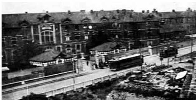
El tranvía eléctrico a su paso por el Hospital

El hospital de Basurto cuenta hoy con unas instalaciones de 1ª línea, se adapta a las nuevas demandas de los usuarios y pone en marcha su II Plan de Remodelación acometiendo, en un horizonte de 20 años los siguientes cambios: