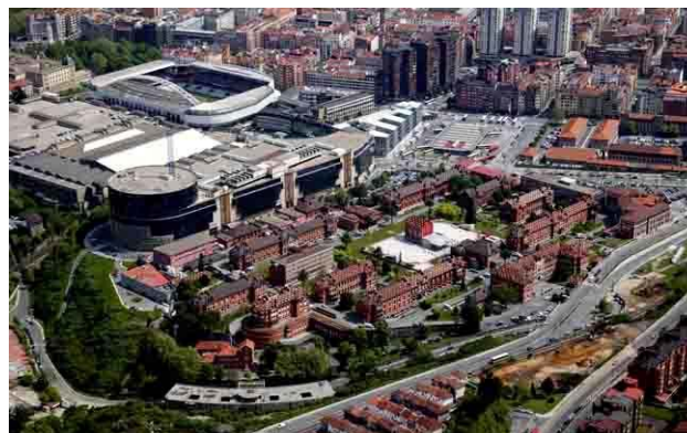
Vista aérea actual del Hospital

accesibilidad hace necesaria su ampliación hasta la ubicación definitiva en el nuevo edificio