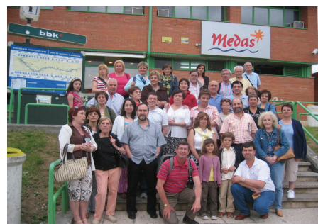
Excursión Cultural a Navarra en Junio 2007

La Asamblea aprobó el Balance de ingresos y gastos y los Presupuestos para 2008. La cuota anual para el 2009 será 8 €. En página aparte destacamos las Actividades aprobadas para este año