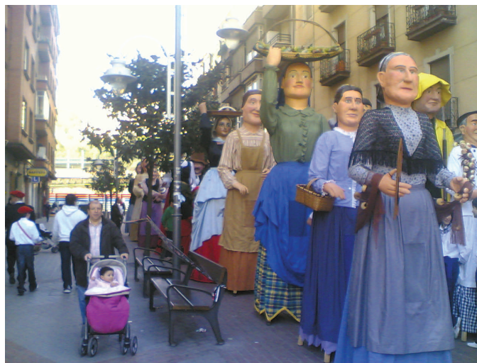
Los gigantes y cabezudos en Iturribarría

Diciembre 24: Pasacalles con Olentzero (Basurto, 17:00)